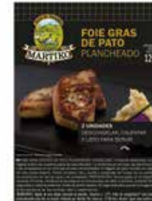
40313 ESCALOPE DE FOIE GRAS DE PATO EXTRA MARCADO 65 G