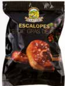
40014 ESCALOPE DE FOIE GRAS DE PATO EXTRA ESPECIAL BANQUETE 40-55 G