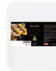
40113 BOMBONES DE FOIE GRAS DE PATO 90-100 UNID.