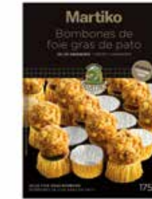
40316 BOMBONES DE FOIE GRAS DE PATO 20-22 UNID.