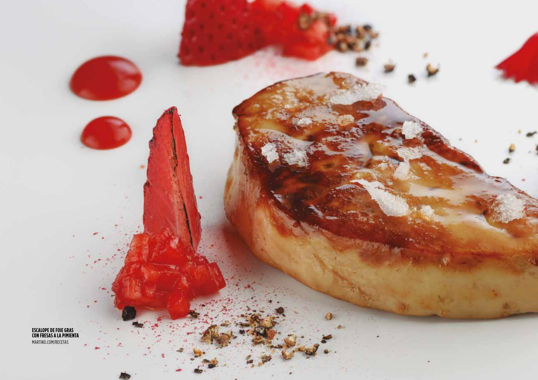
ESCALOPE DE FOIE GRAS CON FRESAS A LA PIMIENTA MARTIKO.COM/RECETAS