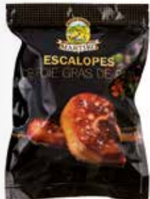
40012 ESCALOPE DE FOIE GRAS DE PATO PRIMERA 40-60 G