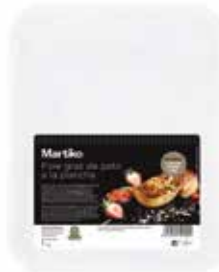
40000 ESCALOPE DE FOIE GRAS DE PATO EXTRA MARCADO 60 G