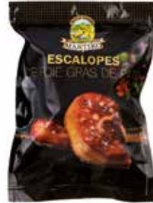
40016 ESCALOPE DE FOIE GRAS DE PATO PRIMERA LONCHA FINA 26-32 G