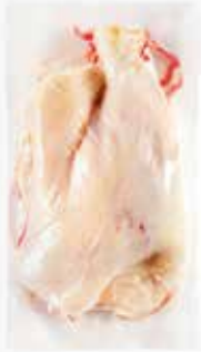
20118 MUSLO DE PATO