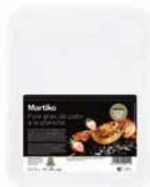
40011 ESCALOPE DE FOIE GRAS DE PATO EXTRA MARCADO 25 G